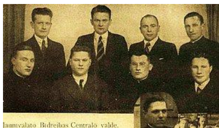
Izmucalotā Bīdreibas Centrālā valde.